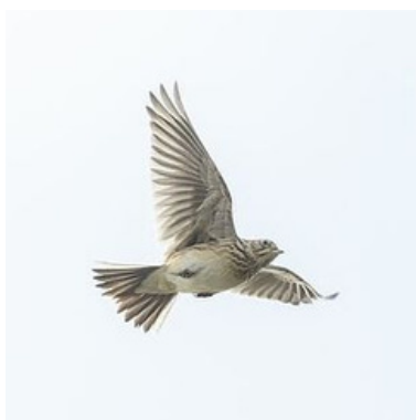
Feldlerche: Dieter Damschen

Treffpunkt: Bockwindmühle in Wanzer 39615 Wanzer